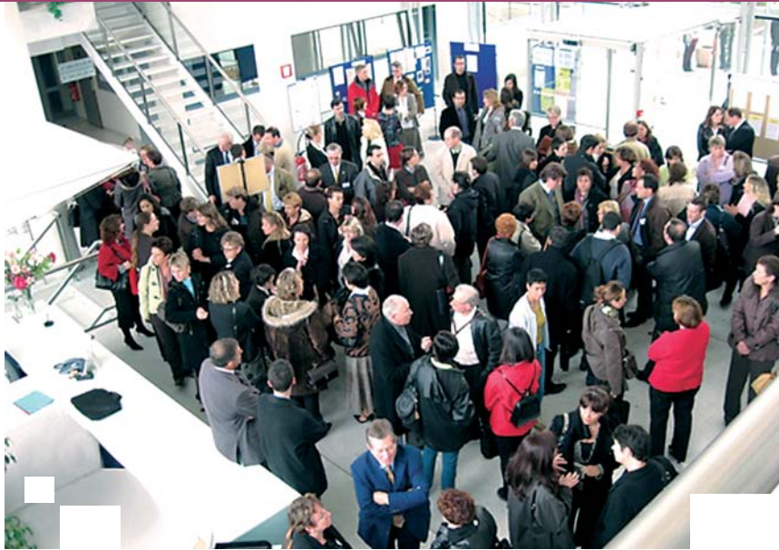
L'Université du Notariat de la Nièvre a été organisée au centre national de formation professionnelle de Nevers.