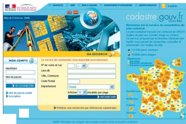
La page d'accueil du site cadastre.gouv.fr .

L'année 2007 a également vu l'aboutissement du projet de mise en ligne sur Internet du plan cadastral permettant l'ouverture du site www.cadastre.gouv.fr depuis le 30 janvier 2008.